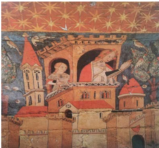
Sala de la Justicia, Alhambra