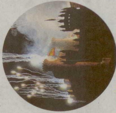
Respaldo. Más de mil personas participan en el desfile templario

Como complemento a estas actividades, Ponferrada se adorna estos días con banderolas y estandartes que evocan aquellos tiempos medievales, cuan-