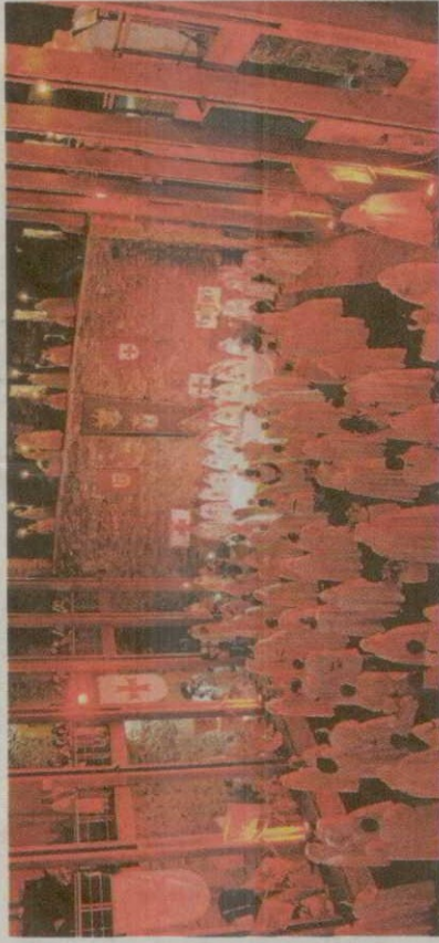
Castillo de Ponferrada, uno de los principales escenarios de la recreación

Es la cita más destacada de la Noche Templaria, que, ahora, se ha convertido en una sucesión de cinco días