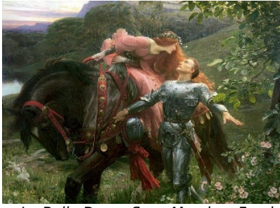
« La Belle Dame Sans Merci » - Frank Dicksee